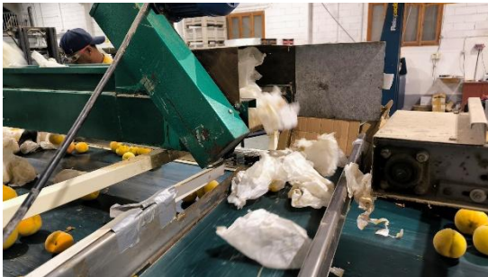
ADQUISICIÓN DE PRENSA PARA BOLSAS DE EMBOLSADO (Mazaleón)