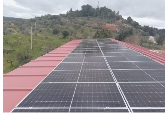
INSTALACION DE AUTOCONSUMO COLECTIVO EN FORNOLES