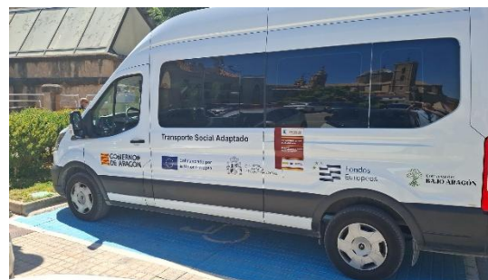
SERVICIO DE TRANSPORTE ADAPTADO COMARCA BAJO ARAGON