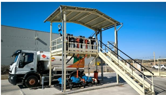
ALMACEN y distribución DE COMBUSTIBLES (Alcorisa)