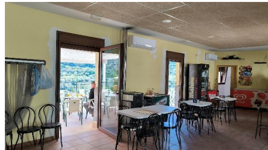
ADECUACION EXTERIOR PARA TERRAZA DEL BAR MUNICIPAL (Seno)