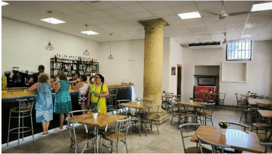
MODERNIZACION INSTALACIONES MULTISERVICIO RURAL