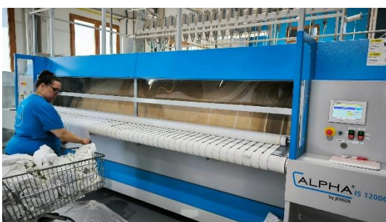
CALANDRA DE PLANCHADO DE GAS LAVANDERIA INDUSTRIAL (La Fresneda)