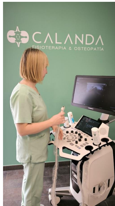
MODERNIZACION Y RENOVACION DE ECOGRAFO EN CENTRO DE FISIOTERAPIA (Calanda)