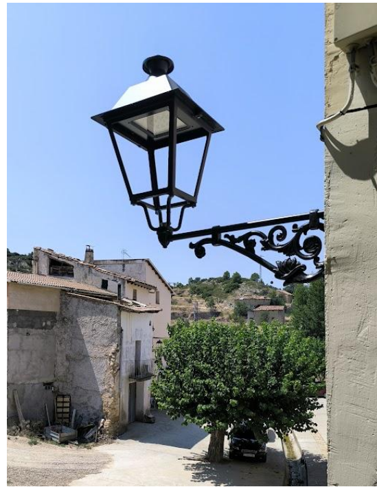
RENOVACION DE ALUMBRADO PUBLICO MEJORA LUMINICA Y EFICIENCIA ENERGETICA (Las Parras de Castellote)