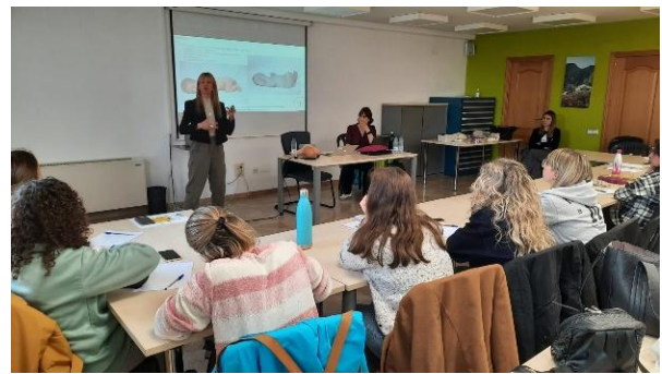
FORMACION PARA PROFESIONALES DE ESCUELAS DE EDUCACION INFANTIL (Comarca Matarraña)