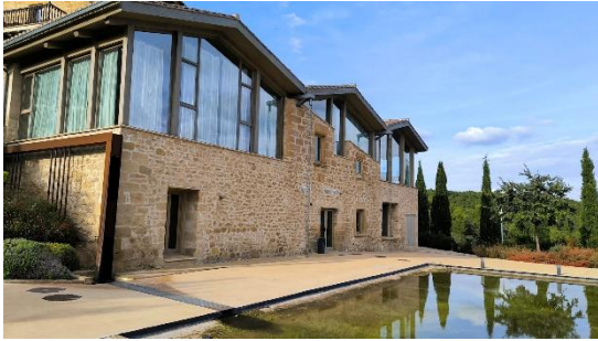
MEJORAS EN HOTEL TORRE DEL MARQUES (Monroyo)