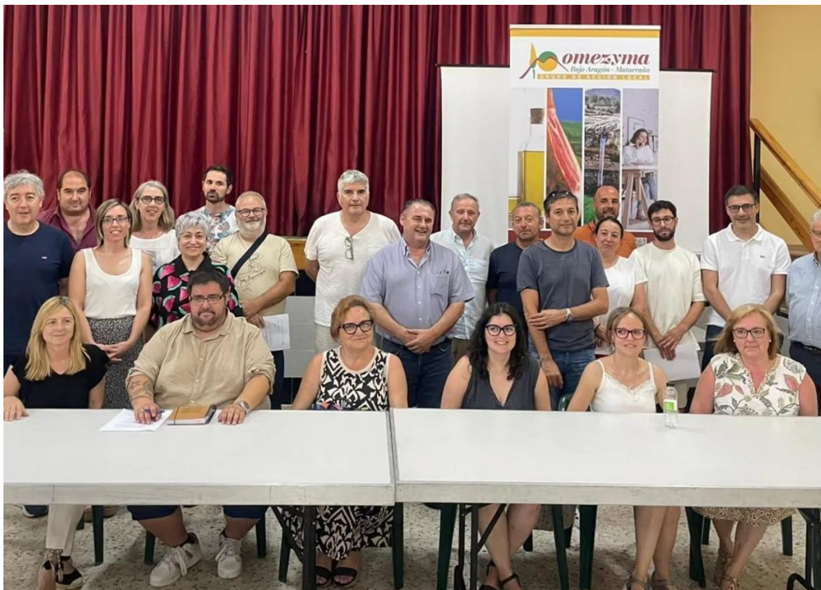
Asamblea ordinaria de socios, La Cañada de Verich 30 de junio 2025