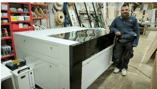
MAQUINA DE CORTE Y GRABADO LASER (Valdeatorrada)