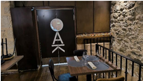
ACONDICIONAMIENTO DE LOCAL PARA APERTURA DE RESTAURANTE (Valderrobres)