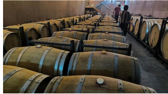
MODERNIZACION DE MAQUINARIA EQUIPAMIENTO Y MEJORAS EN BODEGA (Lledó)