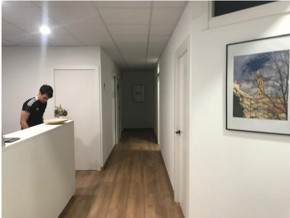
CREACION DE CENTRO DE FISIOTERAPIA EN ALCORISA