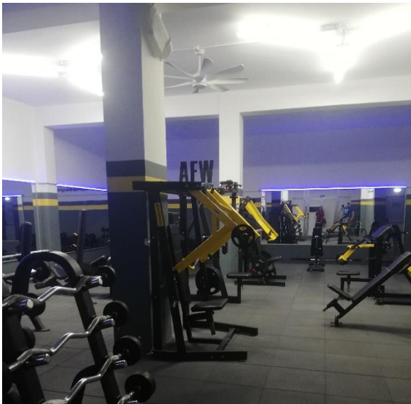
CREACION DE GIMNASIO DE FITNESS Y CULTURISMO EN ALCAÑIZ