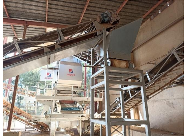
NUEVA PLANTA DE LIMPIEZA Y CLASIFICADO ACEITUNA EMPELTRE EN ALCAÑIZ