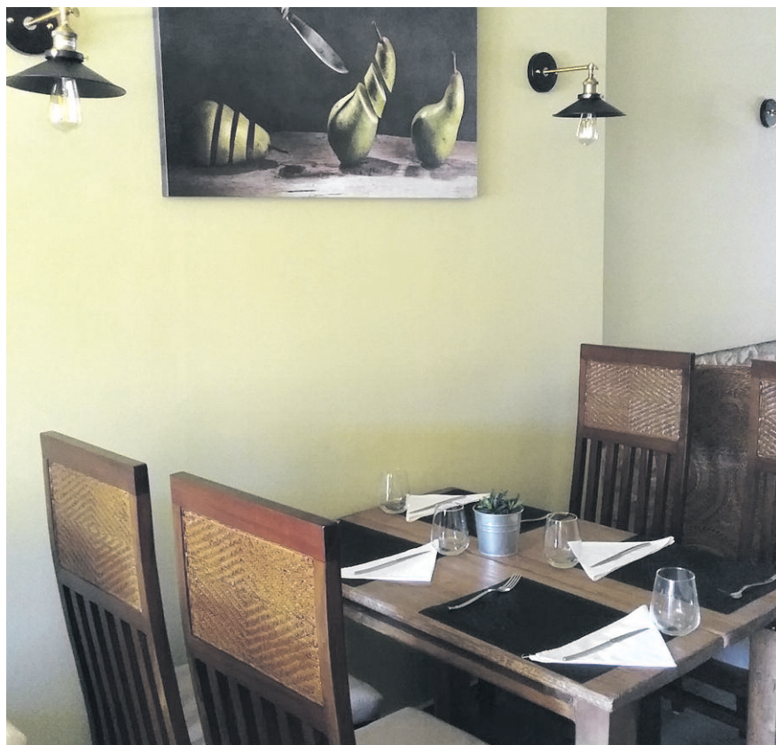
Instalaciones del establecimiento puesto en marcha en La Cañada de Verich