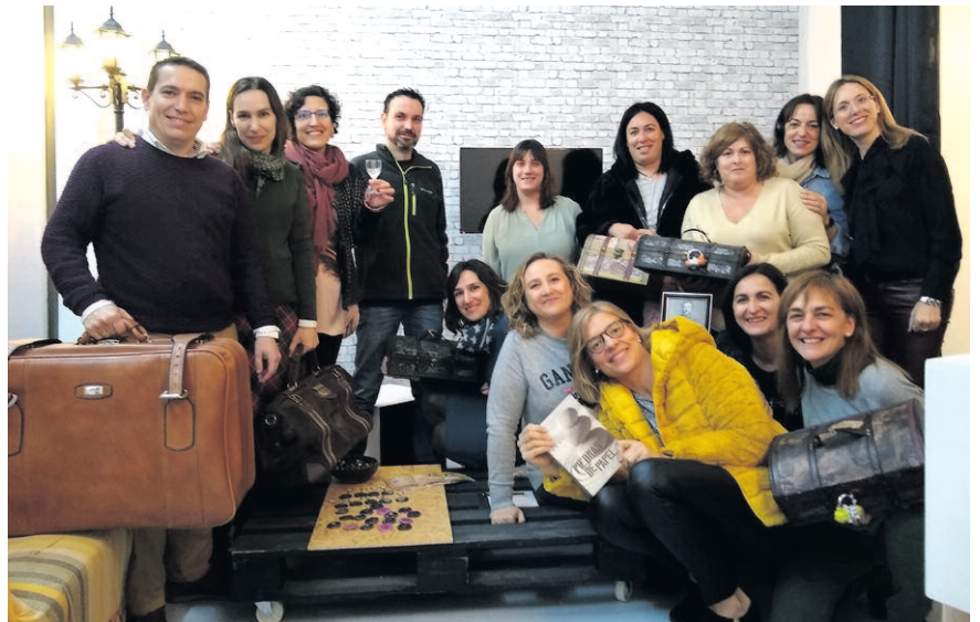
Participantes en una de las propuestas de Escapa Teruel

Destaca también la importancia de que los gestores de turismo rural lo promocionen e incorporen en sus propuestas, y la importancia del trabajo colaborativo entre las empresas que ofertan esta experiencia, como ya