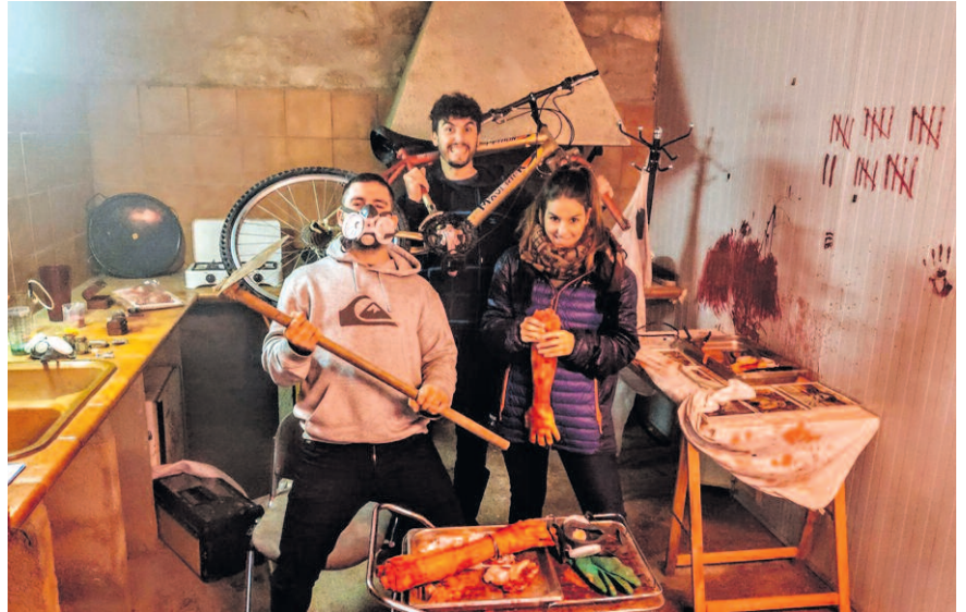
Uno de los grupos que ha disfrutado de la actividad de Matarraña Aventura