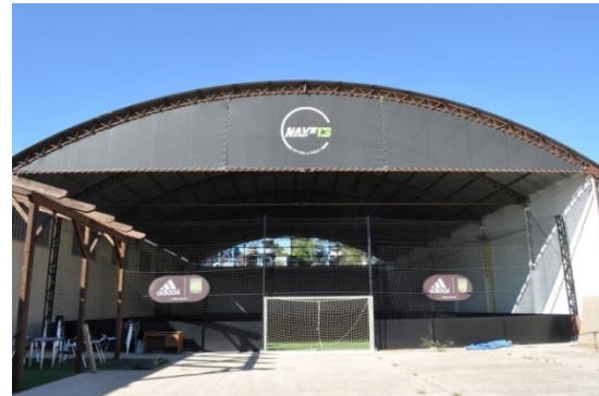
2019.10.2.017 INSTALACION PADEL Y FUTBOL INDOOR EN ALCAÑIZ