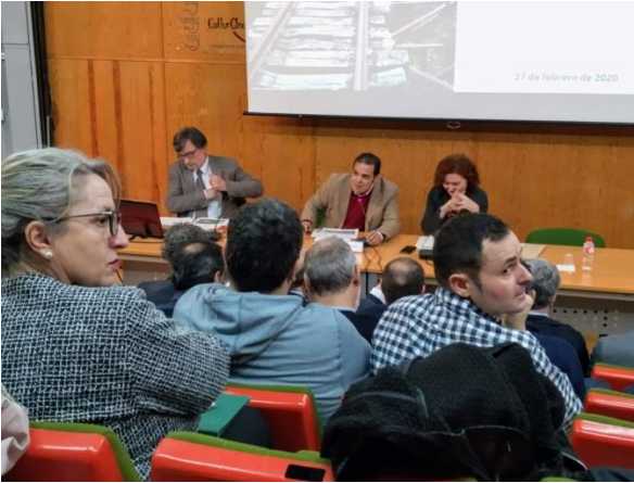
Reunión informativa sobre el plan de transición justa en Andorra