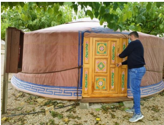
2020.10.2.002 MODERNIZACION CAMPING 2 CATEGORIA EN VALDERROBRES