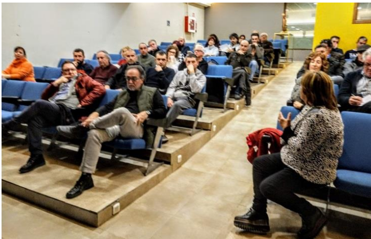
Reunión con ayuntamientos y empresarios celebrada en Fuentespalda.

Conjuntamente con los ayuntamientos y las asociaciones de empresarios, se han realizado charlas participativas y explicativas en las poblaciones que lo han solicitado, en concreto se han realizado en Fuentespalda, Alcorisa, Mas de las Matas y Belmonte de San José. También se han hecho envíos por e-mail a través de la red de contactos de los socios, asociaciones de empresarios, cámara de comercio y ayuntamientos de las convocatorias y criterios del Grupo.