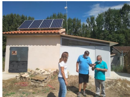
2019.10.2.023 INSTALACION FOTOVOLTAICA PARA ELEVACION DE AGUA