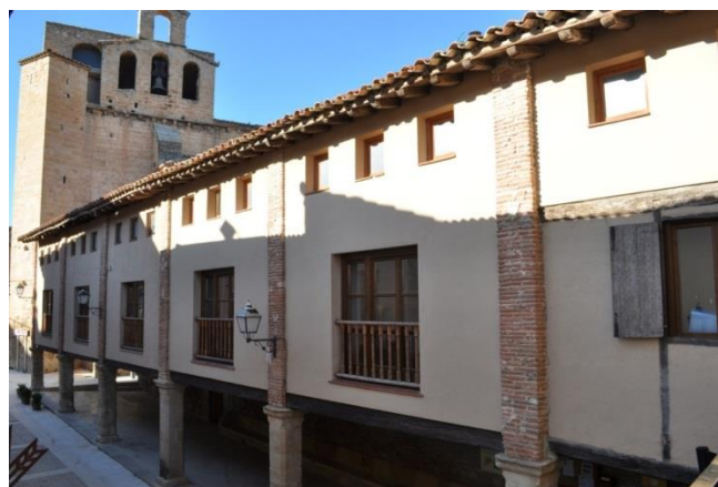
2018.10.2.065 MEJORA DEL ENVOLVENTE TERMICA DEL EDIFICIO Ayto de Ráfales