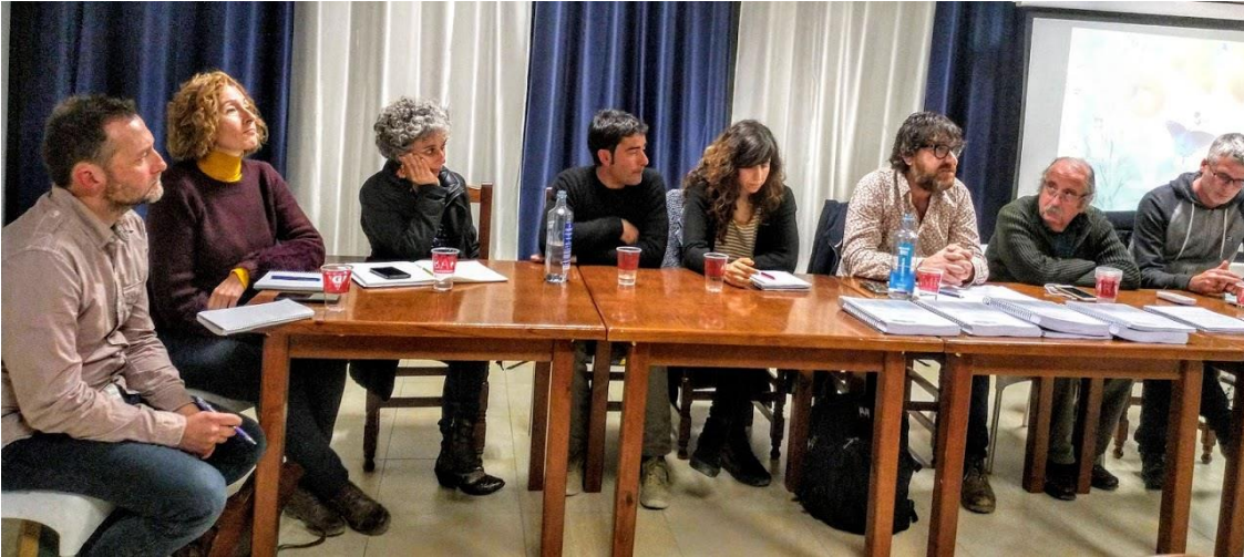
Reunión informativa sobre los parques eólicos en Valjunquera