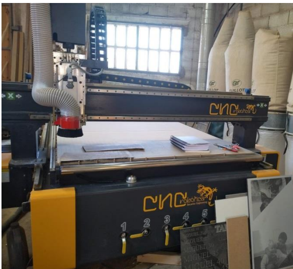
2019.10.2.037 Modernización Carpintería

Algunos ejemplos con sus fotografías de los proyectos certificados: