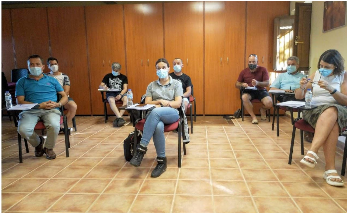
Consejo de dirección para la aprobación de la propuesta del 1 Tramo 2020