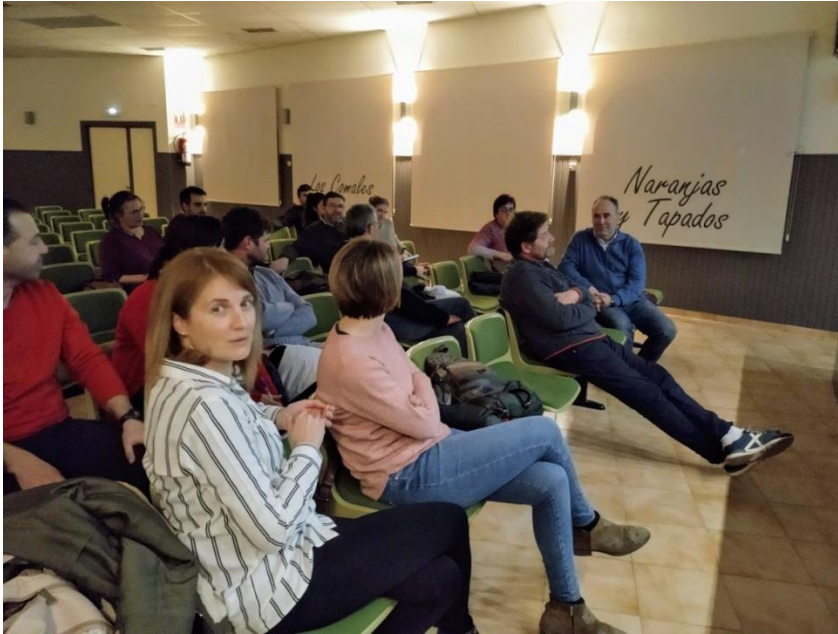
Jornada para explicar la convocatoria 2020 en Alcorisa