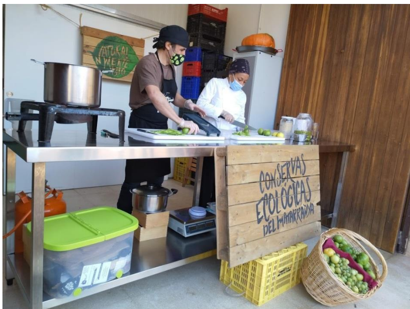
Jornada agroexperiencia elaboración de mermeladas en Ráfales.