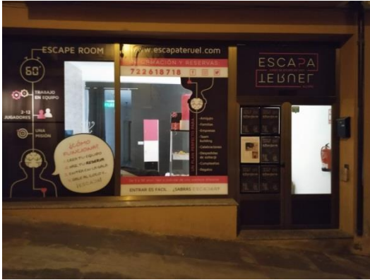
2018.10.2.036 - ESCAPE ROOM – ALCAÑIZ