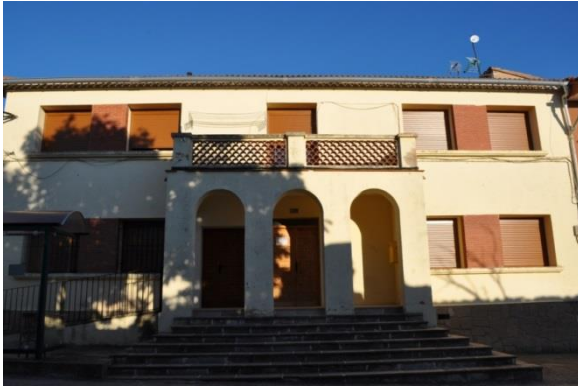
2018.10.2.055 SUSTITUCIÓN DE CARPINTERIA EXTERIOR DE EDIFICIO MUNICIPAL PARA AHORRO ENERGÉTICO en Torre del Compte.