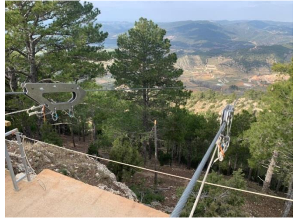
2018.10.2.058 - TIROLINA GIGANTE DE FUENTESPALDA-MATARRAÑA-ARAGON