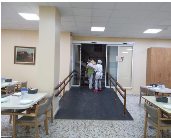
2018.10.2.063 - RESIDENCIA DE PERSONASMAYORES MIXTA en Alcorisa