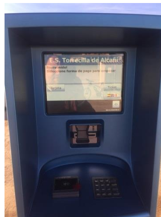
2019.10.2.002 MODERNIZACION POSTE DE GASOLEO