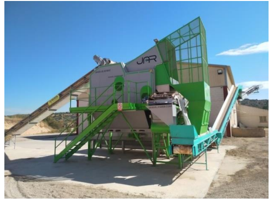
2019.10.2.034 PLANTA RECEPTORA DE OLIVA Y EVACUACION DE RESIDUOS