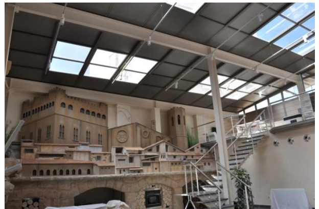
2019.10.2.001 AMPLIACION ALMACEN Y CERRAMIENTO TERRAZA EN HOTEL EL SALT