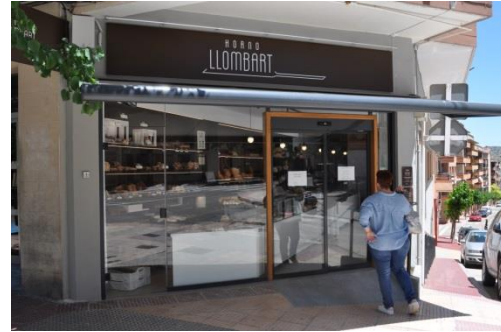
2019.10.2.044 CREACION DE PANADERIA PASTELERIA Y CAFETERIA en Alcañiz.