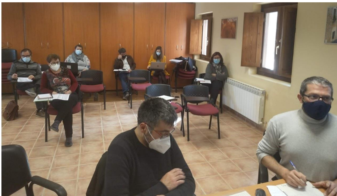
Reunión socios presencial y online de la red SSPA en la sede de OMEZYMA en Torrelilla.