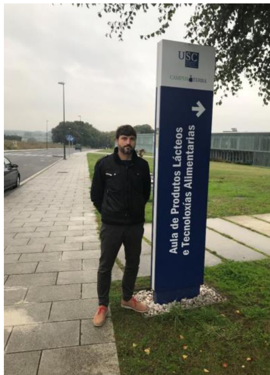
2018.10.2.014 Desarrollo de una bebida vegetal a partir de semillas de cáñamo