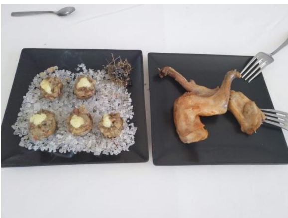
2018.10.2.006 FABRICACION Y VENTA DE CARACOLES RELLENOS en Mas de las Matas