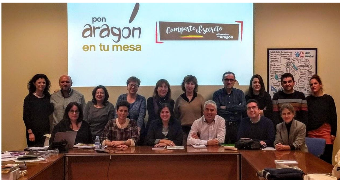
Reunión de socios PAETM y seguimiento EDLL con DGA