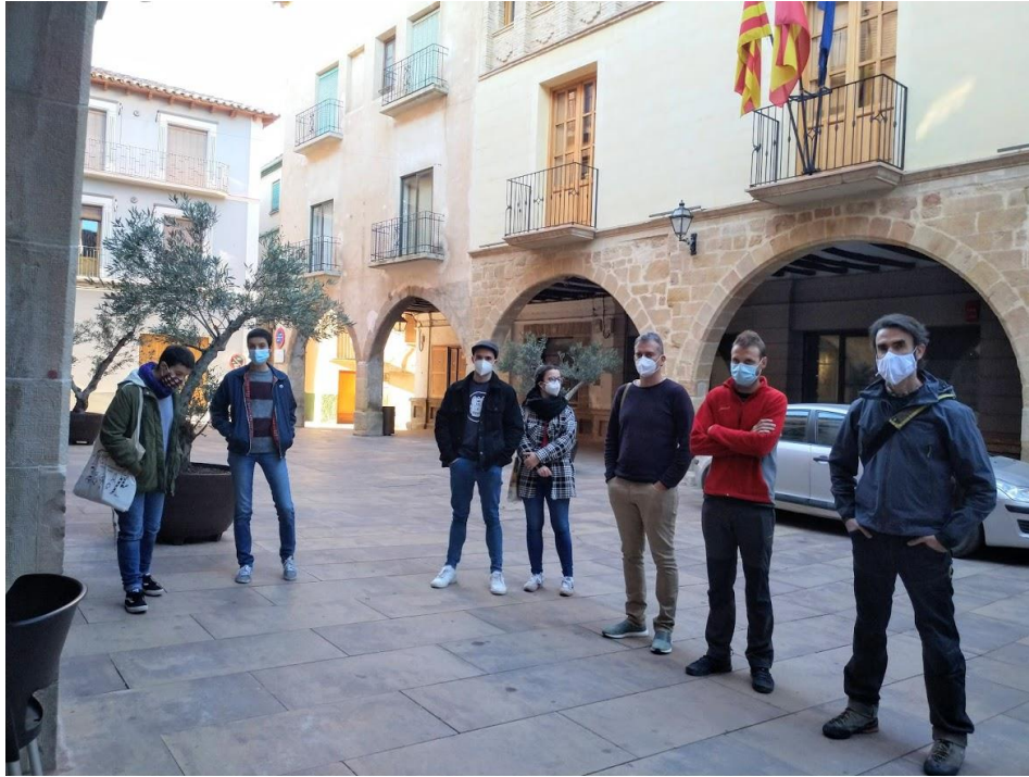
Explicación de la E.D.L. Leader a jóvenes en el marco del JDR en Alcorisa