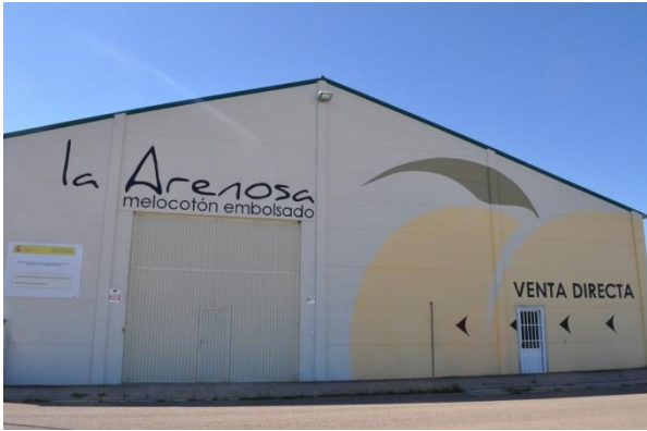
2019.10.2.038 MODERNIZACION DE LINEA DE TRANSFORMACION Y VENTA DE MELOCOTON DE CALANDA