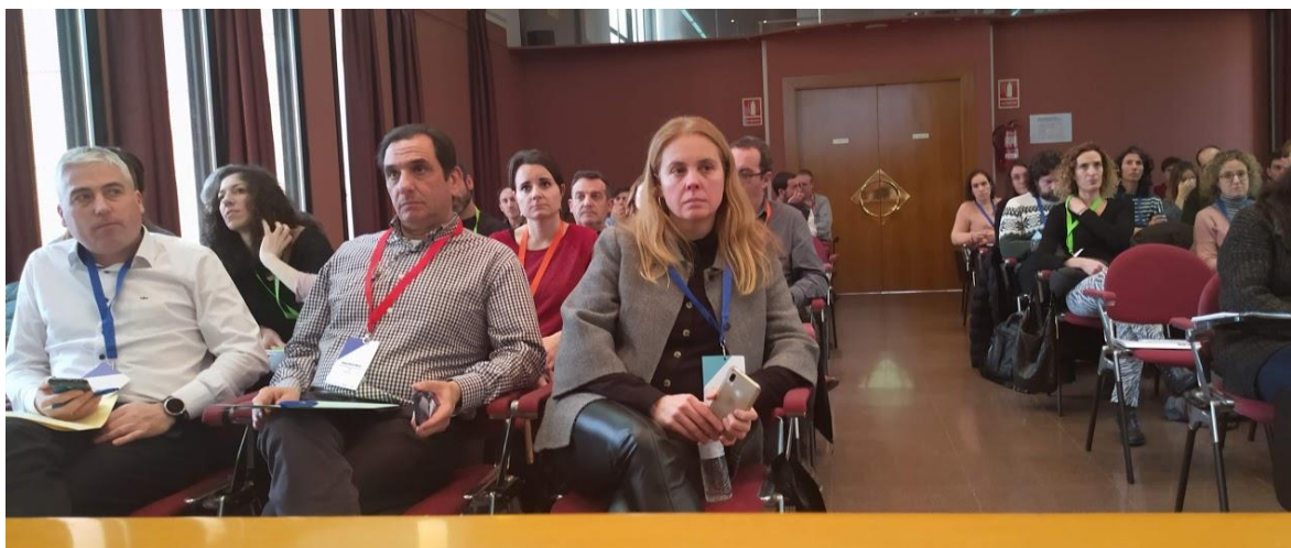
Jornadas de cooperación entre grupos de Aragón y Cataluña celebradas en Balaguer.