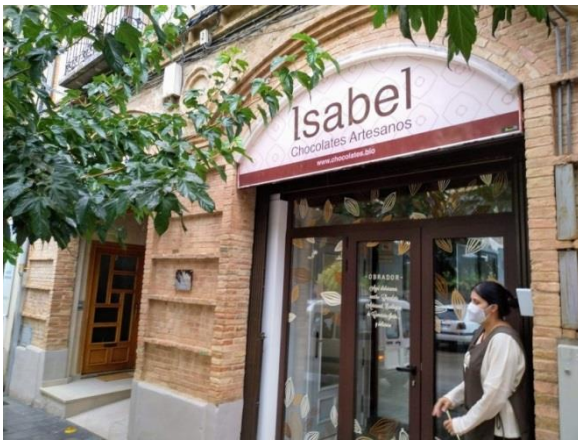
2019.10.2.041 MODERNIZACION FABRICA DE CHOCOLATE ARTESANO