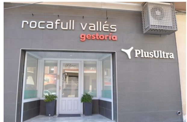
2019.10.2.013 SISTEMA DE CLIMATIZACION Y EQUIPOS INFORMATICOS en Calanda