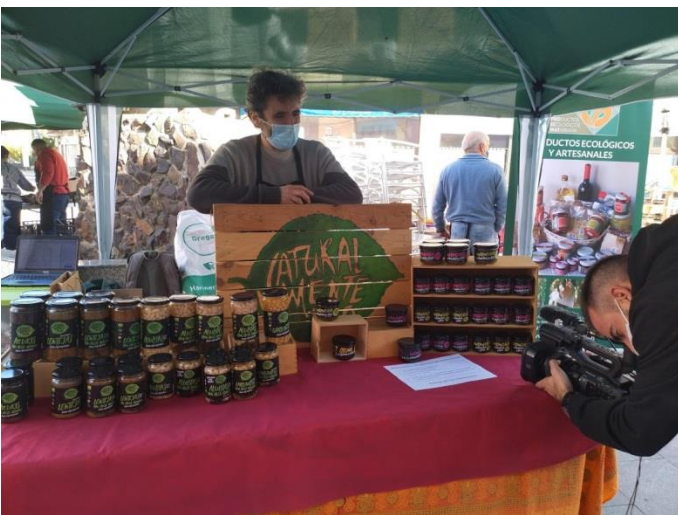
Visita al agromercado de Andorra