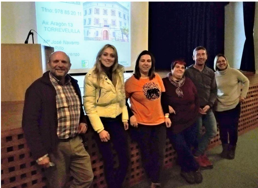
Jornada explicativa del LEADER celebrada en Mas de las Matas