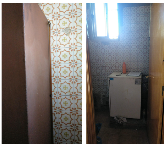
Depósito de gasóleo y caldera de gasoil (1)