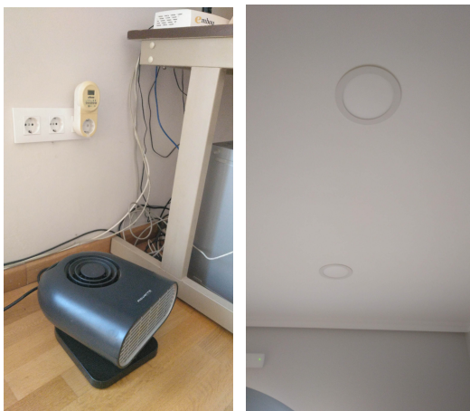
Estufa eléctrica e iluminación tipo LED