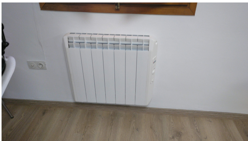
Radiador eléctrico efecto joule